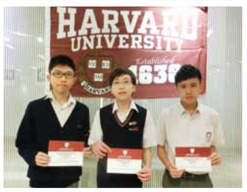
Harvard Club of Hong Kong Harvard Book Prize 2014 Winner and Runners-up