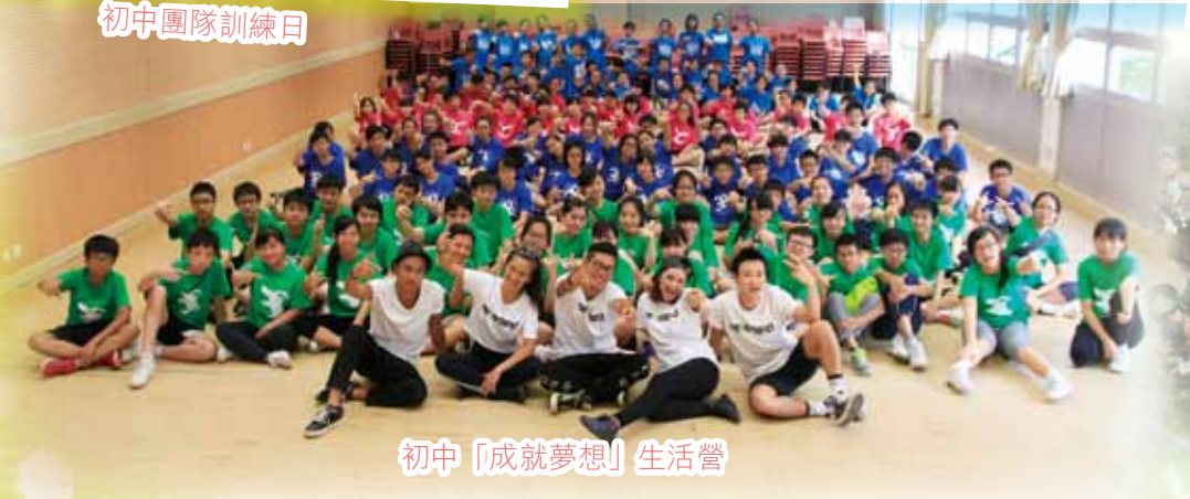
初中「成就夢想」生活營