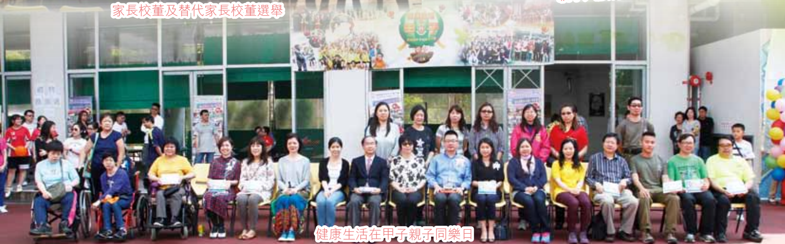
健康生活在甲子親子同樂日