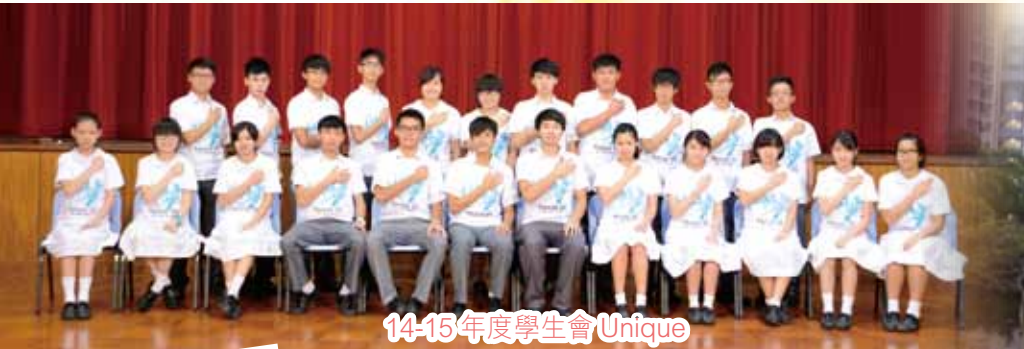
14-15 年度學生會 Unique