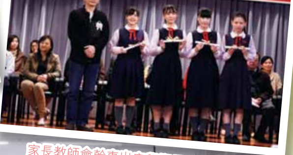
家長教師會幹事出席學期頒獎禮頒發獎項