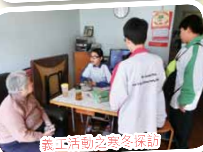
義工活動之寒冬探訪