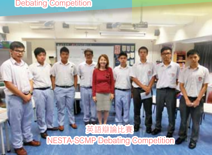
英語辯論比賽 NESTA-SCMP Debating Competition