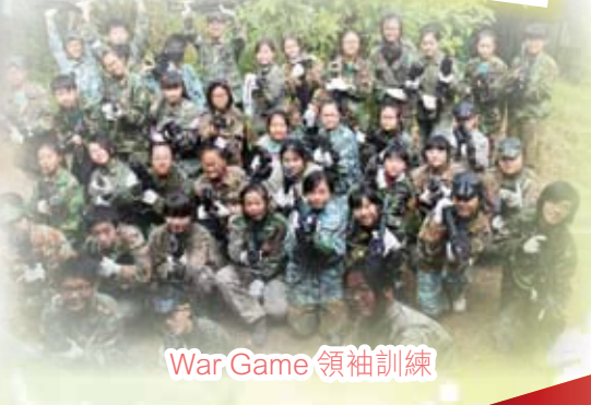
War Game 領袖訓練