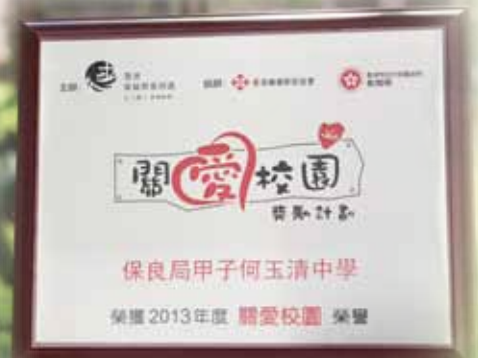
香港基督教服務處「關愛校園獎勵計劃」 連續三年獲「關愛校園」榮譽