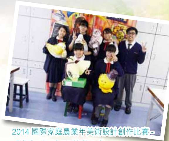
2014 國際家庭農業年美術設計創作比賽 - 香港賽 (組別 5) 3 等獎 6 名