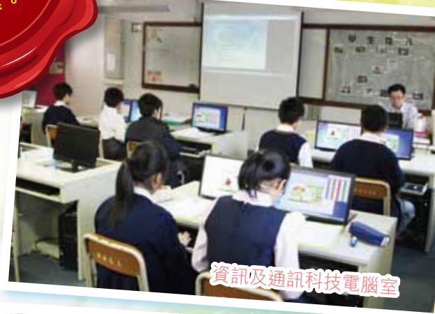
資訊及通訊科技電腦室