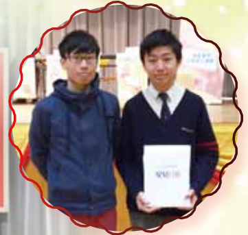
星島第 30 屆全港校 際辯論比賽最佳辯 論員 3 名、「最佳 交互答問辯論員」 獎 2 名