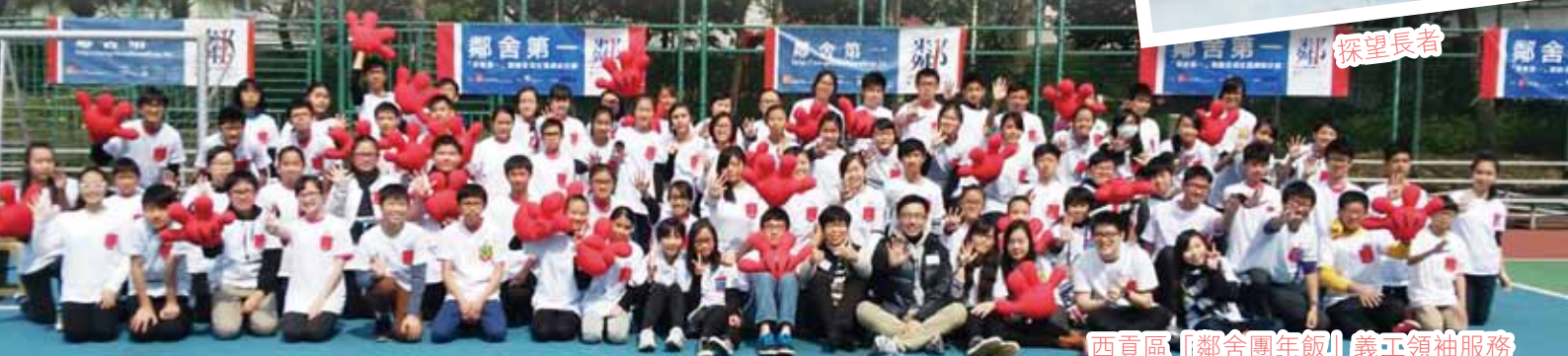
西貢區「鄰舍團年飯」義工領袖服務