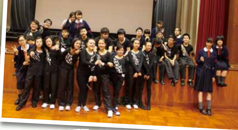
第 66 屆香港學校朗誦節 英文集誦 (Choral Speaking) 季軍、 語言與動作表達 (Words and Movements) 季軍