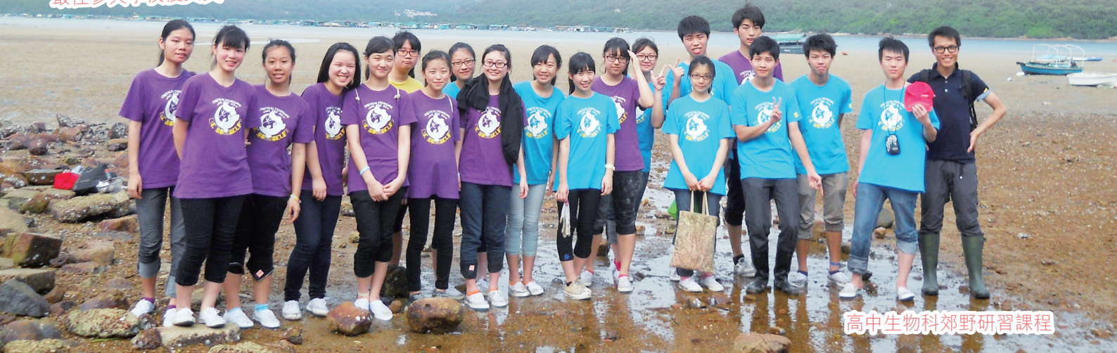
高中生物科郊野研習課程