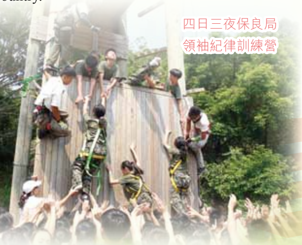
四日三夜保良局領袖紀律訓練營