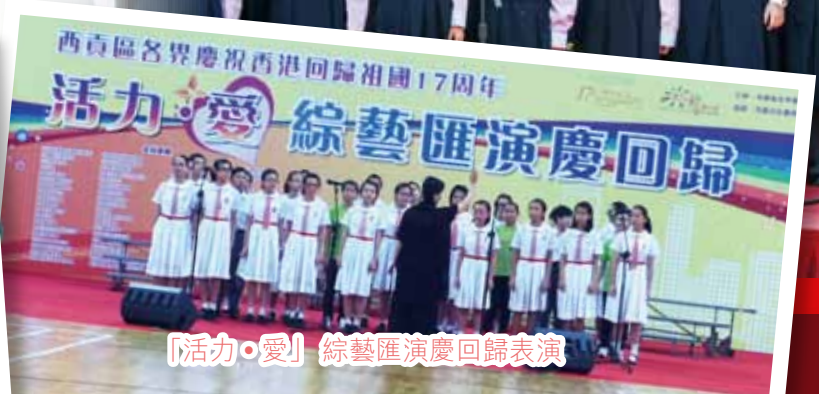
「活力·愛」綜藝匯演慶回歸表演