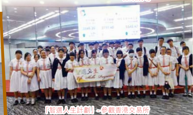
「智選人生計劃」-參觀香港交易所