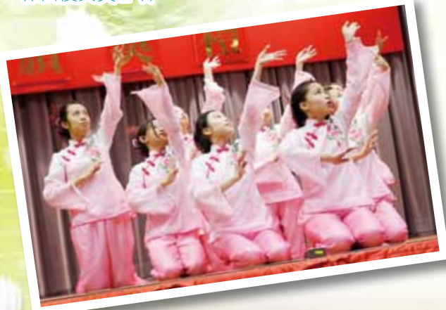
第 42 屆全港公開舞蹈比賽中國舞 (群舞) 銅獎