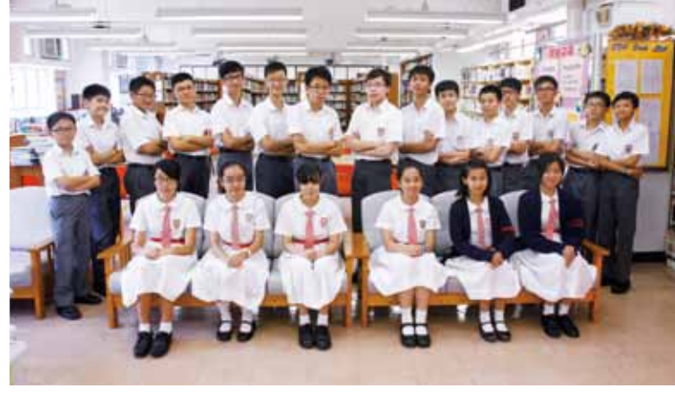
2014 澳洲新南威爾斯大學「國際聯校學科評估」 優異獎 8 名、優良獎 20 名。