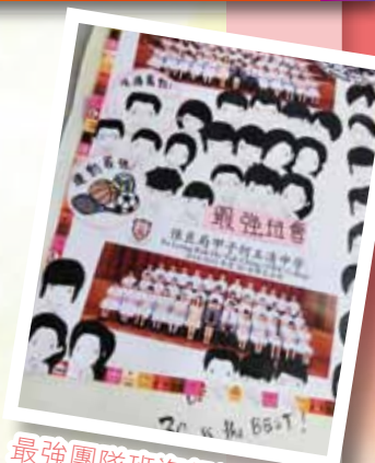
最強團隊班海報設計比賽

本校有幸連續三年榮獲香港基督教服務處「關愛校園獎勵計劃 BLESS」比賽「關愛校園」榮譽。我們深信，在一個著重推動生命教育及充滿著「愛」的校園環境下成長的學生，必能在身、心、靈得到全面發展，將來貢獻社會及回饋國家。