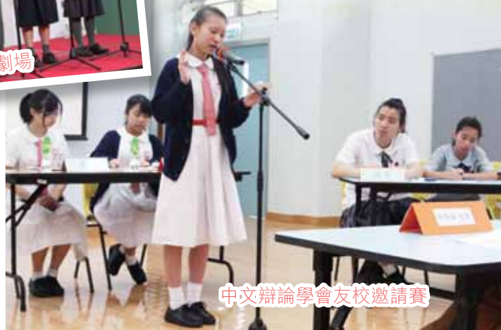
中文辯論學會友校邀請賽