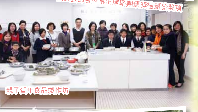
親子賀年食品製作坊