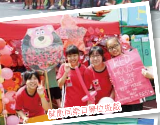
健康同樂日攤位遊戲

健康生活對每一個人均是相當重要，希望在甲子家長、老師及學生之積極合作及推廣下，甲子學生能建立健康生活，活出快樂的人生。