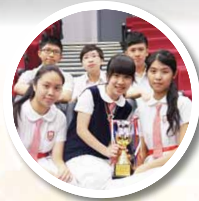
15th NESTA-SCMP Debating Competition Division 2B Runner-up