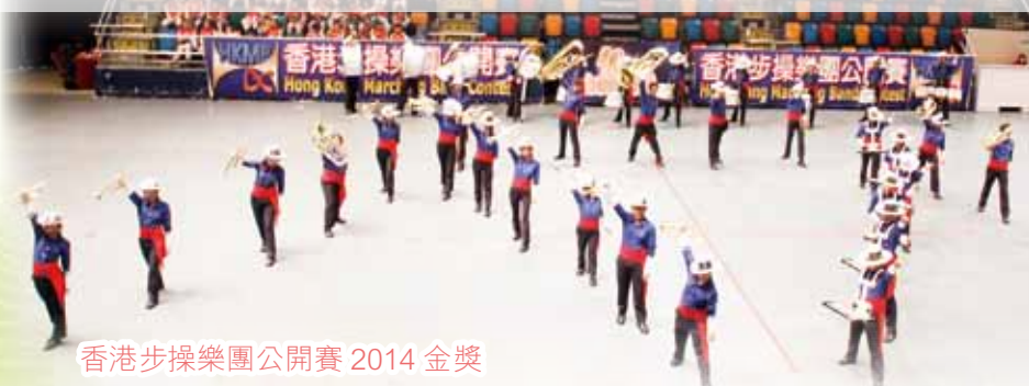
香港步操樂團公開賽 2014 金獎