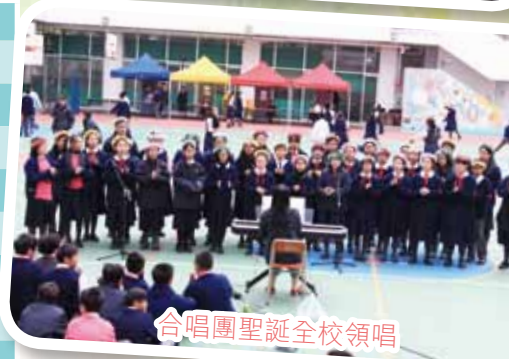
合唱團聖誕全校領唱