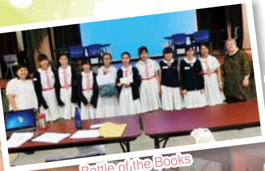
Battle of the Books