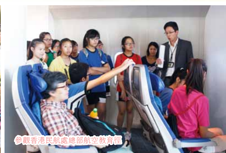
參觀香港民航處總部航空教育徑