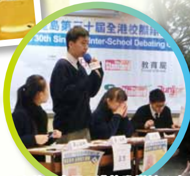
星島第三十屆全港校際辯論比賽