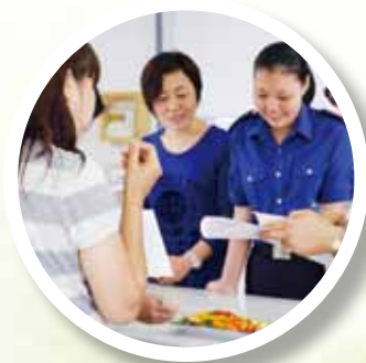
健康生活在甲子之 親子烹飪比賽