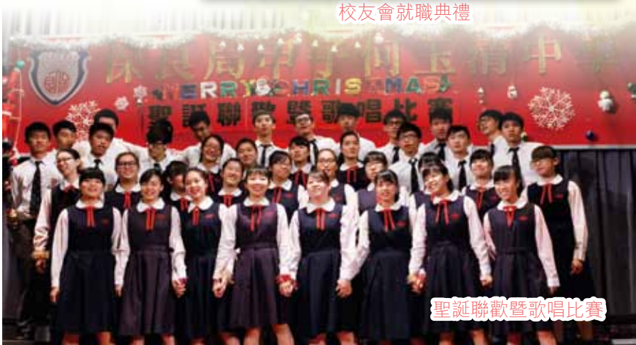
聖誕聯歡暨歌唱比賽