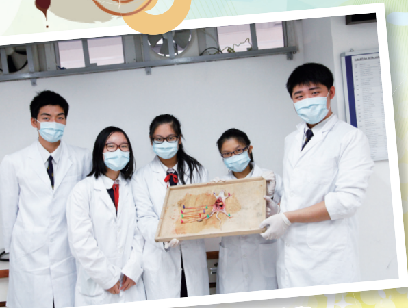
生物科解剖白老鼠