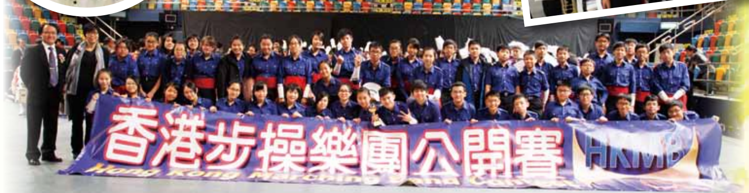
香港步操及鼓號樂團協會香港步操樂團公開賽 2014 金獎