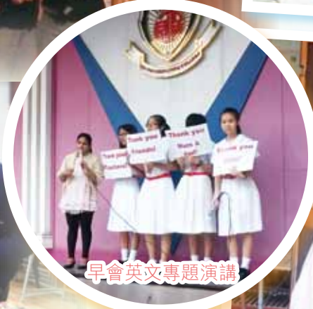
早會英文專題演講