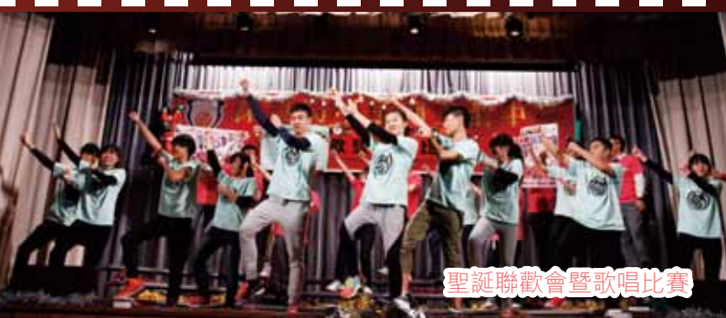
聖誕聯歡會暨歌唱比賽