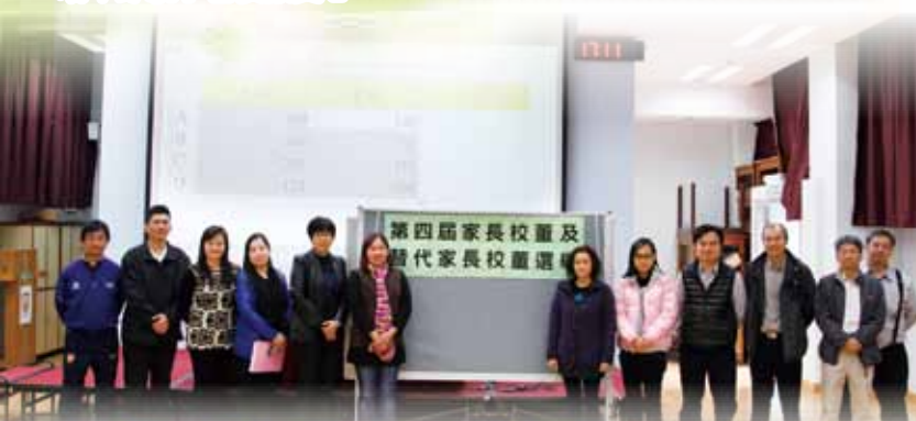
家長校董及替代家長校董選舉