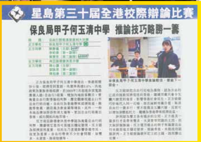
星島日報辯論比賽報導