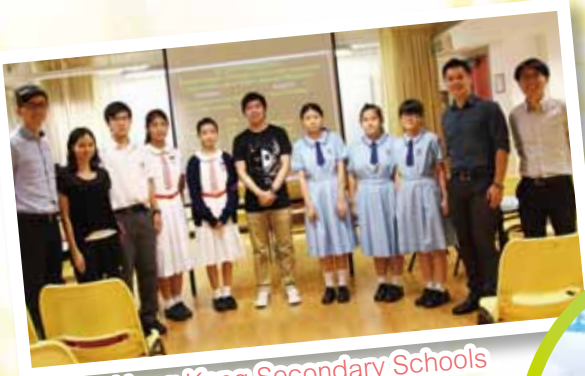
The Hong Kong Secondary Schools Debating Competition