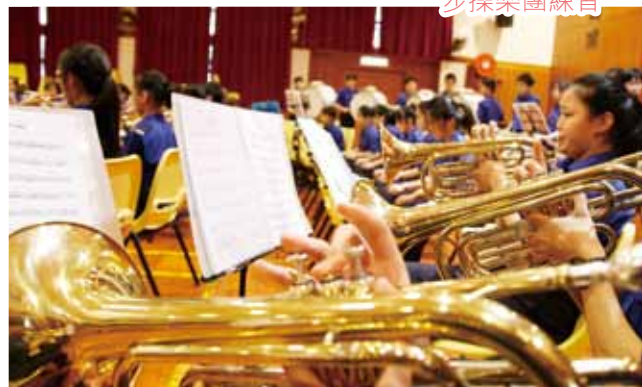
SDU 步操結業禮樂團演奏

本校於 2010 年獲得保良局李兆忠優質教育基金撥款發展 SDU 步操樂團，目標是建立一隊多元化的八十人大樂團。此活動讓學生在這音藝表演平台上盡展所長，發光發亮，建立更強的自信和團隊精神。SDU 步操樂團於 2013 年獲香港步操樂團公開賽銀獎，並於 2014 年勇奪金獎。樂團亦曾獲邀參與多個典禮作表演，如「保良局董事會就職典禮」、「西貢區中學巡禮」、「香港花卉展覽」等。經過恆常的訓練和各樣的表演，更讓學生明白「台上一分鐘，台下十年功」的道理。