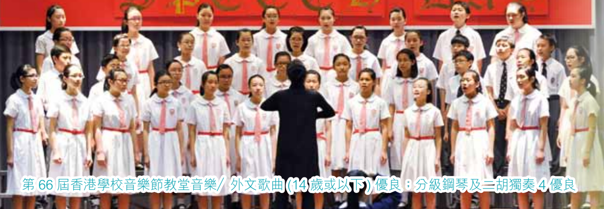
第 66 屆香港學校音樂節教堂音樂 / 外文歌曲 (14 歲或以下) 優良 : 分級鋼琴及三胡獨奏 4 優良