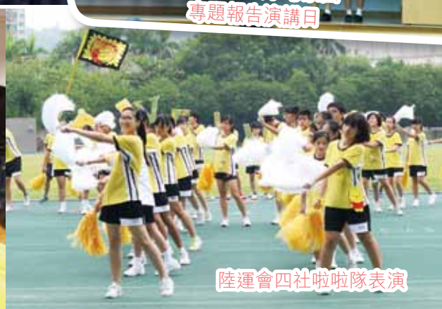
陸運會四社啦啦隊表演