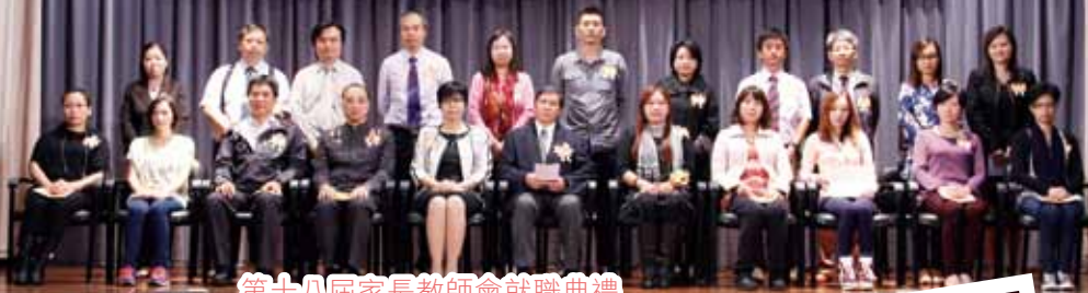
第十八屆家長教師會就職典禮