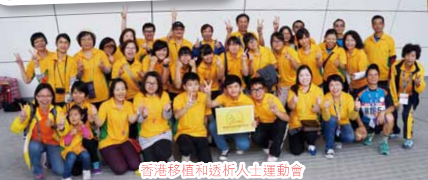
香港移植和透析人士運動會