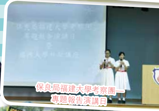
保良局福建大學考察團一 專題報告演講日