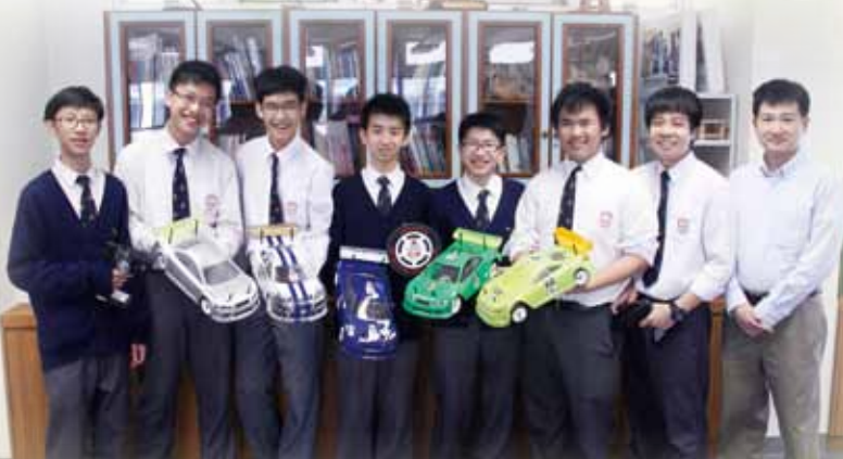
全港學界遙控模型車賽 2015 獲獎個人賽初級 C 組亞軍