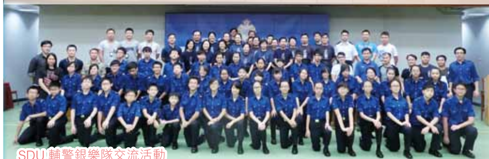
SDU 輔警銀樂隊交流活動