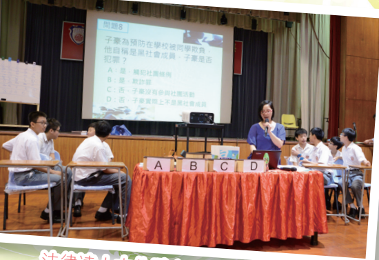
法律達人大作戰之百法百中問答比賽