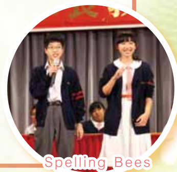
Spelling Bees Competition