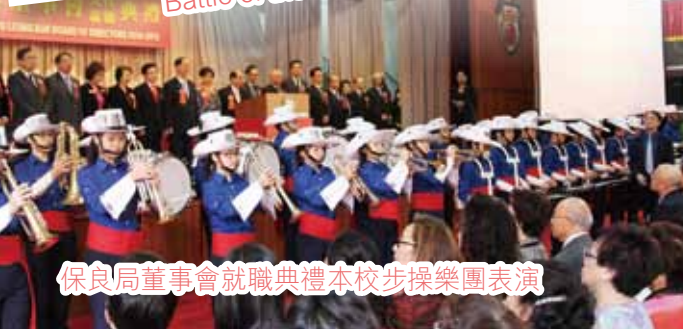
保良局董事會就職典禮本校步操樂團表演