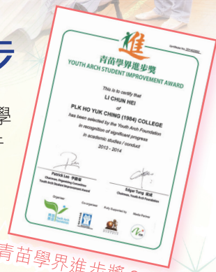
青苗學界進步獎 28 名

本校注重愉快學習，採用靈活之教學法，配合學生之不同需要，以活動輔助教學。本校積極推行中文、英文課外閱讀，如閱讀獎勵計劃、鼓勵多元化閱讀、拓展閱讀場地等。為增進學習，本校特設平時修習及假期補課，並採用連續及式評核方法作調適。