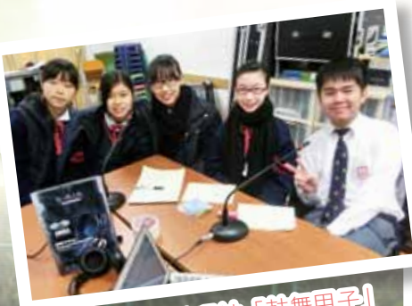
關愛校園點唱站「鼓舞甲子」