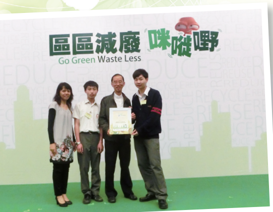
減廢回收在校園塑膠再生變資源 最佳參與學校優異獎