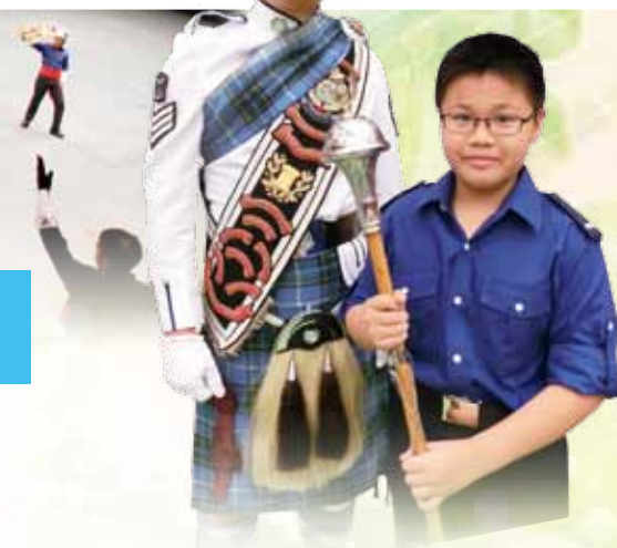
SDU 輔警銀樂隊交流活動

賞團計劃，透過學生校內面試結果，校方會向相關機構申請導賞團，並於暑期安排獲配對的學生作實地參觀，讓學生對自己的理想有更深切的認識，預早在學業選科和成績上作好準備，過去曾經觀摩的行業包括旅遊、航空、醫療、幼兒教育、環保和美容服務等。