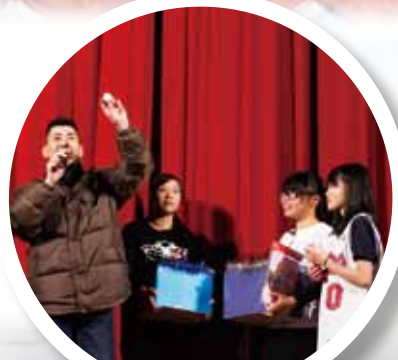
聖誕聯歡暨歌唱比賽 家長教師會家長現場抽獎