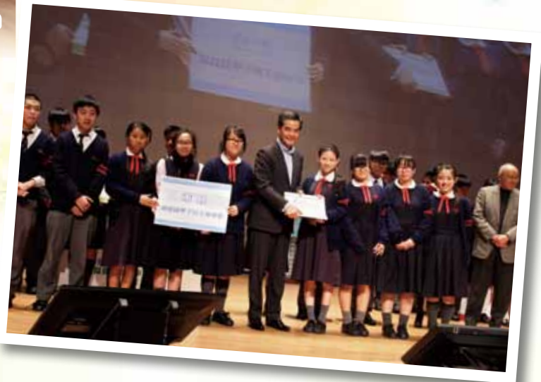
保良局青聯盃 4D 校際多角度辯論賽傑出辯論隊及 最佳辯論員 (初賽)