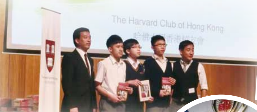
Harvard Club of Hong Kong Harvard Book Prize 2014 Winner and Runners-up