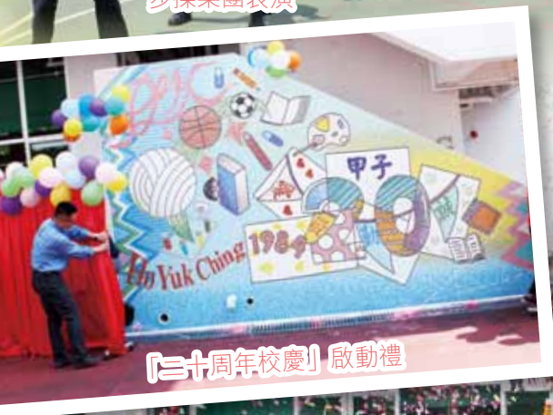
「二十周年校慶」啟動禮