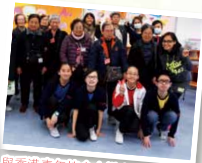
與香港青年協會合辦之耆少同樂日