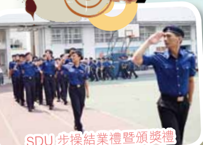
SDU 步操結業禮暨頒獎禮

In Moral Education, core beliefs and values are put across in morning assemblies, class teachers' time, seminars, small group sessions, weekly assemblies, the materials and activities devised by our teachers in Moral Education sessions, in Social Study lessons, counselling activities, volunteer services and leadership training. An award scheme has been introduced to encourage excellent performance in conduct, study, services and activities.