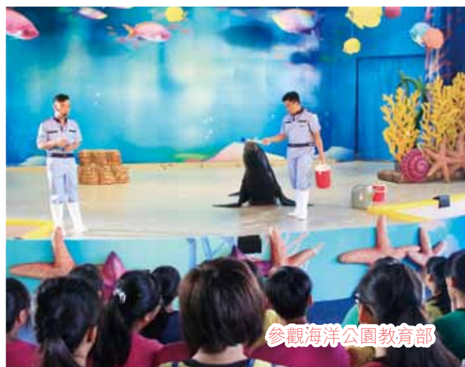
參觀海洋公園教育部