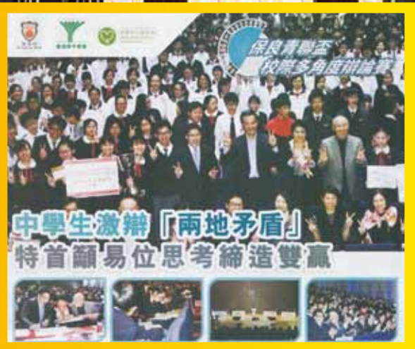
保良青聯盃校際多角度辯論賽