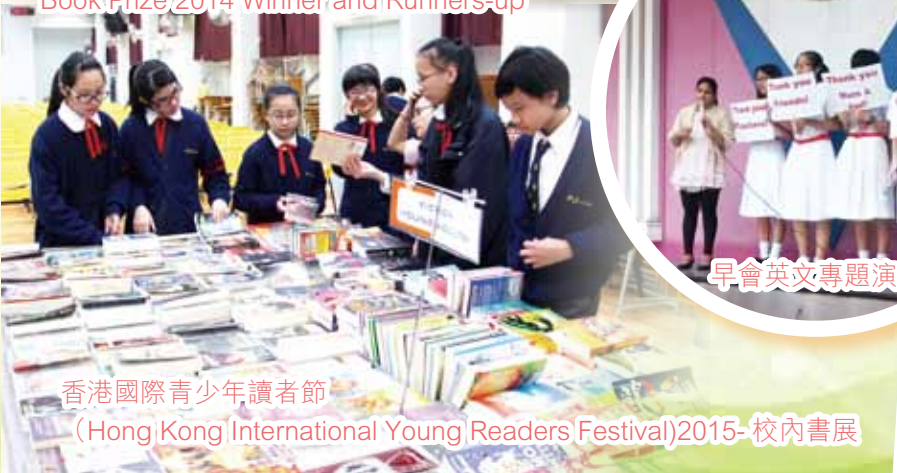
香港國際青少年讀者節 (Hong Kong International Young Readers Festival) 2015- 校內書展