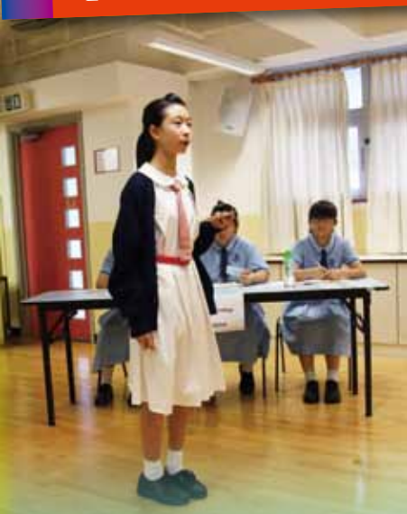
英語辯論比賽 Hong Kong Secondary Schools Debating Competition

英語辯論為學生學習英語的重要媒介，目的在訓練學生思辨能力，及提高在特定語境下的英語運用能力，是以本校自五年前已成立英語辯論隊，骨幹成員為中二至中五學生。為提升學生掌握辯論技巧，校方特延聘校外專業機構，由外籍老師教授有關知識，並安排學生參觀校際的英語辯論比賽，藉以吸收經驗，啟發思考，增強信心及樂趣。受訓後，表現優異的初中辯論員會被安排參加友誼賽，而高中辯論員則會參加 Hong Kong Secondary Schools Debating Competition 或 NESTA-SCMP Debating Competition。發展至今，本校英語辯論隊表現理想，成績良佳，去年更在上述兩項賽事中獲得冠軍及亞軍，各項比賽中亦不乏辯論員榮膺『最佳辯論員』殊榮。