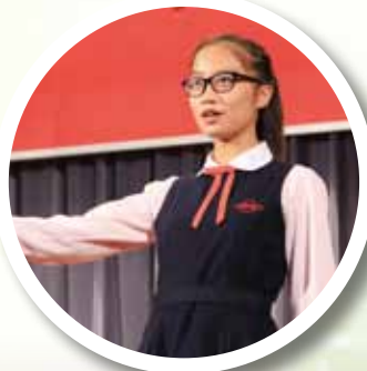
第 66 屆香港學校朗誦節中英文散文 及詩詞獨誦 1 季軍及 38 優良